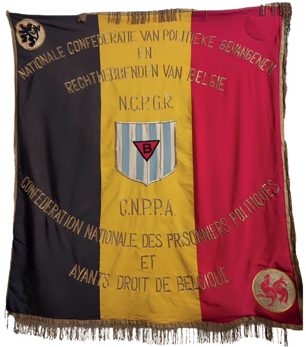
Fahne der Nationalen Vereinigung der politischen Gefangenen und ihrer Anspruchsberechtigten, 2023

Gefangenenerverbände wie die NCPGR oder der Überlebendenverband der politischen Gefangenen des Strafgefängnisses Wolfenbüttels, der Amicale des Prisonniers Politiques Rescapés de Wolfenbüttel , unterstützen ihre Mitglieder bei der Anerkennung ihrer Interessen.