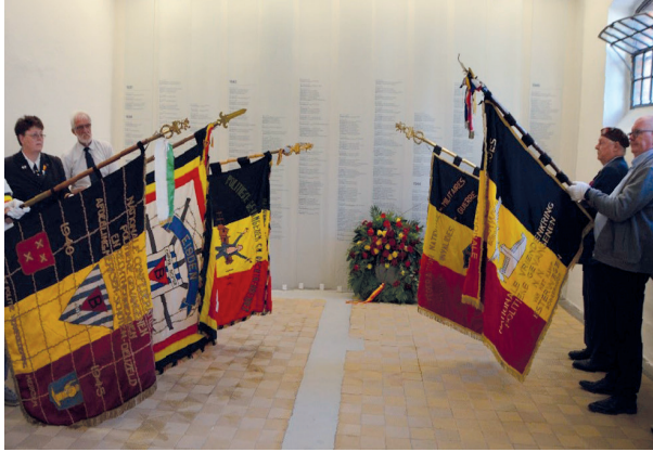
Gedenkzeremonie im ehemaligen Hinrichtungsraum, 2023

Auch heute noch besuchen Mitgliedsverbände der NCPGR die ehemaligen Haftorte belgischer Widerstandskämpfer*innen und halten Gedenkzeremonien ab.