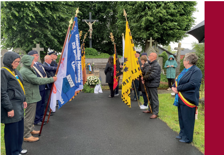
Gedenken zum 80. Jahrestag der Hinrichtung am Gemeinschaftsgrab in Lichtervelde, 2024 Gedenkstätte Wolfenbüttel

Sowohl für die Stadt Lichtervelde als auch für die Familie Callewaert ist es wichtig, die Erinnerung an Eugeen Callewaert und die Widerstandsgruppe „Weiße Brigade“ aufrecht zu erhalten. In Lichtervelde findet jährlich eine Gedenkfeier für die Gruppe statt. 2024 gab es besondere Veranstaltungen zum 80. Jahrestag der Hinrichtung der Widerstandskämpfer.